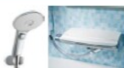
節湯水栓 5,000 円/台