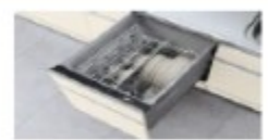
ビルトイン食器洗機 21,000 円/戸