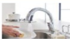
節湯水栓 5,000 円/台