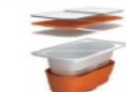
高断熱浴槽 30,000 円/戸